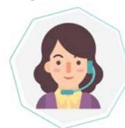
Service de central téléphonique 24/7

La station s'installe dans un lieu de passage du veilleur de nuit. L'application PC et smartphone permet aux gestionnaires de s'assurer à distance que tout va bien. Notre centrale d'assistance est accessible 24/7 et gère les alertes.