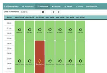
Logiciel central pour les gestionnaires