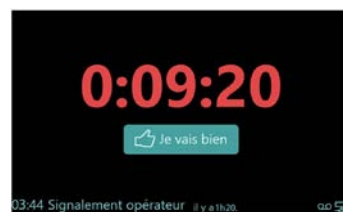
Phase de pré-alerte avant la fin du décompte

Si on approche de la fin du décompte, et que le veilleur ne s'est toujours pas signalé, la station passe en phase de pré-alerte et se met à bipper.